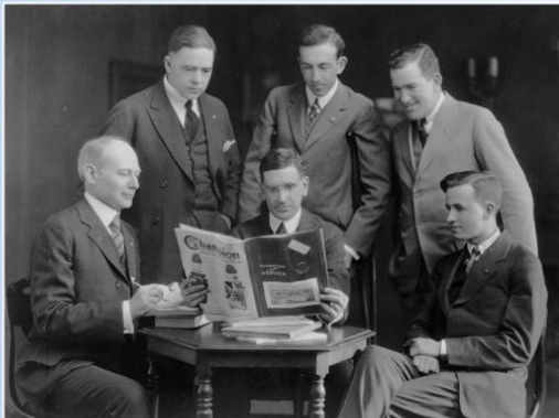
I primi leaders del Rotary International.